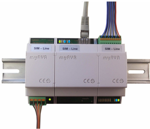
simPower, simEthernet und simControl5 auf einer Hutschiene (von links nach rechts)