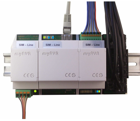
simPower, simEthernet, simControl5 und simConnect (mit 8 Temperatursensoren) auf einer Hutschiene (von links nach rechts)

Bei den Anwendungsbeispielen dient das simPower zur Spannungsversorgung der angeschlossenen Module, das simEthernet zur Erfassung der Nachrichten vom CAN-Bus und zur Weiterleitung dieser Nachrichten via Ethernet ins (Heim-) Netzwerk oder ins WorldWideWeb. Das simControl5 Modul dient der Erfassung der Messdaten und legt diese Daten als Nachrichten auf den CAN-Bus. Im rechten Anwendungsbeispiel werden zusätzliche Messdaten von insgesamt 9 Sensoren durch das simConnect für das simControl5 Modul bereitgestellt, welches diese verarbeitet.